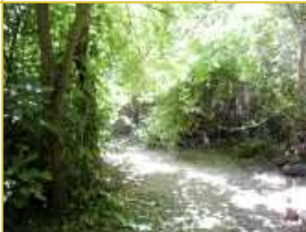
Detalle de la senda