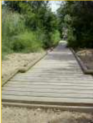
Rampa de acceso al puesto de observación