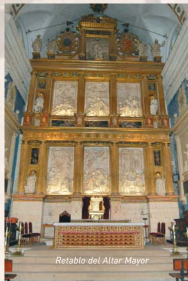
Retablo del Altar Mayor

Regentada por los jesuitas y mandada construir en el siglo XVI por Doña Magdalena de Ulloa . De estilo renacentista herreriano, en ella destacan el Museo, el Retablo del Altar Mayor, el Relicario (conjunto capital de la escultura española), la Capilla del Noviciado y la Cripta , entre otros. También se conservan esculturas, tapices y pinturas, así como una colección de ornamentos sacerdotales.