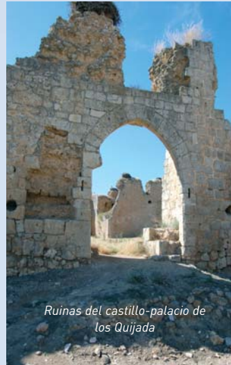
Ruinas del castillo-palacio de los Quijada

Jeromín , hijo natural del Emperador Carlos V , fue confiado por el rey, para su cuidado y educación, a Don Luís Quijada y a su mujer, Doña Magdalena de Ulloa . En su castillo-palacio, pasaría parte de su infancia.