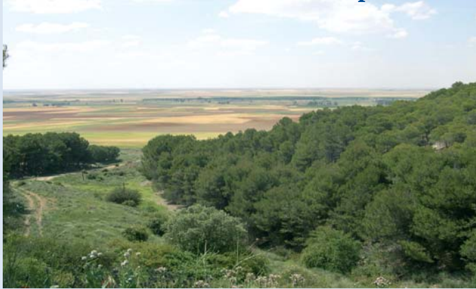
Paisaje de Villagarcía desde los Montes Torozos

Villagarcía , población de 391 habitantes a 53 Kms. de Valladolid, es una ventana-mirador de Tierra de Campos. Si el visitante se asoma a ella desde lo alto de los Montes Torozos, contemplará impresionado el paisaje infinito de campos pardos característicos de la llanura de Castilla.