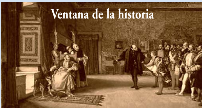
Presentación de Jeromín a Carlos I (E. Rosales)

Villagarcía fue la célebre Intercatia de los vacceos, ciudad inmersa en la vía romana número XXVII entre Astúrica y Caesaraugusta .