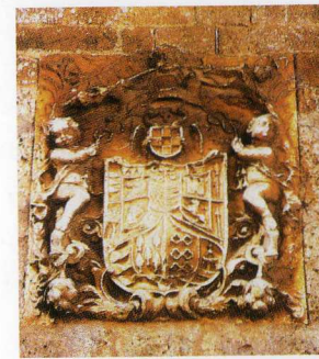
Escudo de la calle Juan Herrero

La Arquitectura Popular y el Ecomuseo , como ejemplo de difusión de las tradiciones y costumbres de nuestro pueblo, abren la puerta a un nuevo gusto por la búsqueda de las raíces en lo básico de la vida. El museo recrea una antigua casa de labranza, con todos sus útiles y aperos y, ofrece una muestra de los oficios básicos de la zona.