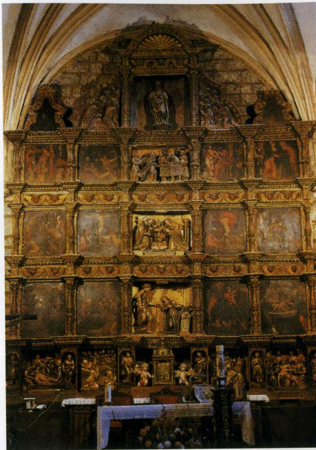
Retablo Mayor Sta. María La Sagrada

La Iglesia de Santiago , de una importante influencia mudéjar, alberga un Retablo de principios del s. XVII, cuya autoría apunta hacia los Maestros de Toro. Un púlpito de estilo gótico labrado en yeso, junto con el artesonado y el coro con restos pictóricos gótico-mudéjares, completan la riqueza del templo.