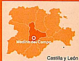
Castilla y León