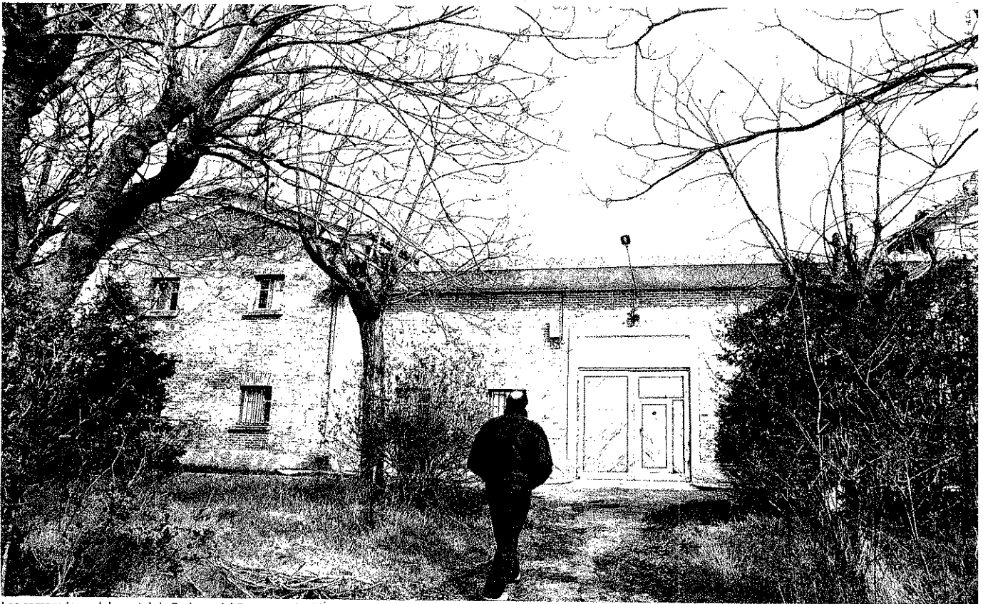
Los compradores del cuartel de Pedrosa del Rey, que adquirieron la propiedad por 72.000 euros, prevén su rehabilitación.