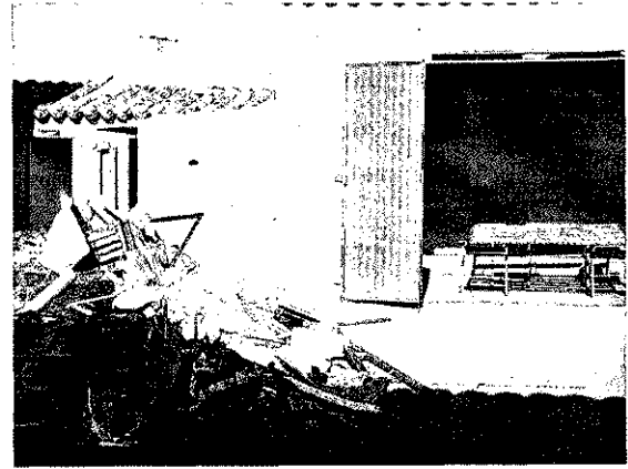
Villafrechós quiere construir en la parcela un centro de mayores.

sólo un inmueble en estado de ruina y bastante peligroso «que para nosotros es una carga y que hemos tenido que solicitar que se cierre a cal y canto para que no se produzca ninguna desgracia», explica De Paz.