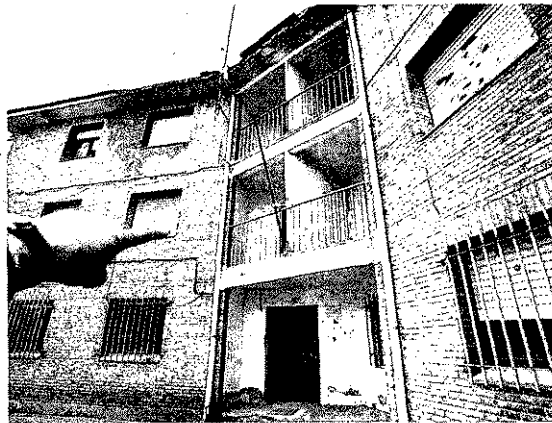
El cuartel de Rueda ocupa una superficie de 800 metros cuadrados.