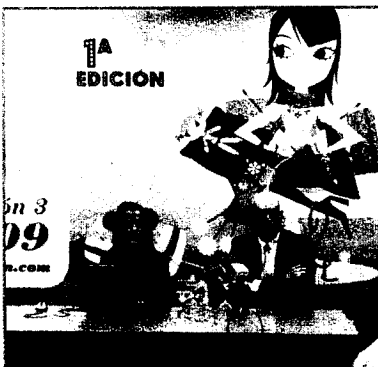
La Feria de Valladolid acoge este fin de semana 'Intra Creativa', un conjunto de talleres y 40 puestos en los que se mostrará las mejores producciones del ocio creativo. Se trata de actividades y objetos manuales, como talleres textiles, cocina creativa, artesanía, decoración, confección de prendas con retales o pintura.