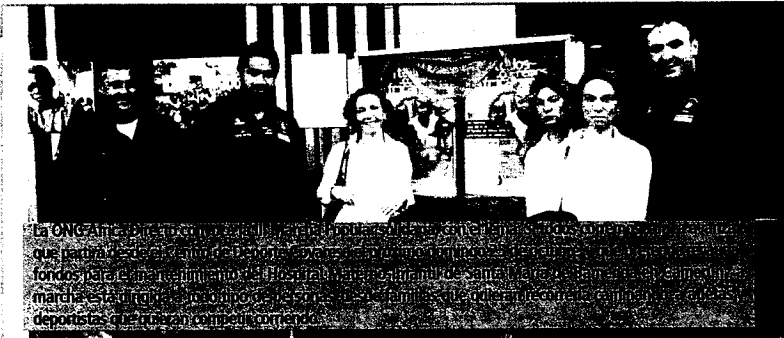
El ONCE organiza una campaña de sensibilización que pretende concienciar a la ciudadanía sobre la importancia de los fondos de reserva regulados para el deporte. En esta ocasión se ha organizado una marcha en el centro de Valladolid, en la que participan deportistas de élite y aficionados.