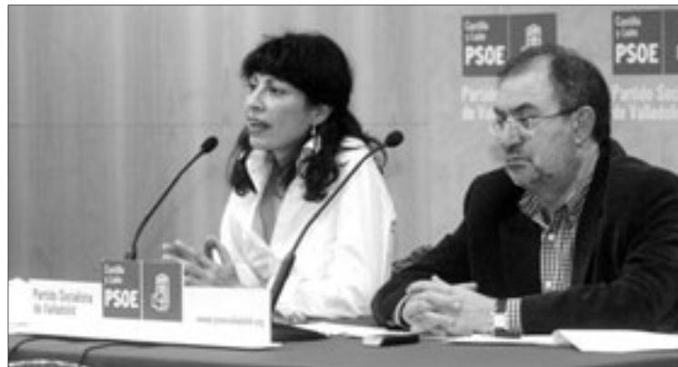
Parlamentarios, senadores y procuradores explicaron ayer las cuentas para Valladolid.

das cuentas para el año próximo relacionadas con la provincia vallisoletana. Precisamente, la preocupación de los afiliados radicó en si las medidas y acciones tomadas serán las adecuadas, preguntas que fueron contestadas por los mencionados dirigentes socialistas al tiempo que hicieron hincapié en que lo peor está por llegar, para lo que pidieron especial atención al gasto de las economías familiares e incidieron en que el dinero aportado por el Gobierno central no invita a ser pesimista precisamente.