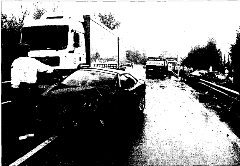
Aunque uno de los vehículos siniestrados quedó en el centro de la carretera, el tráfico no se llegó a interrumpir.