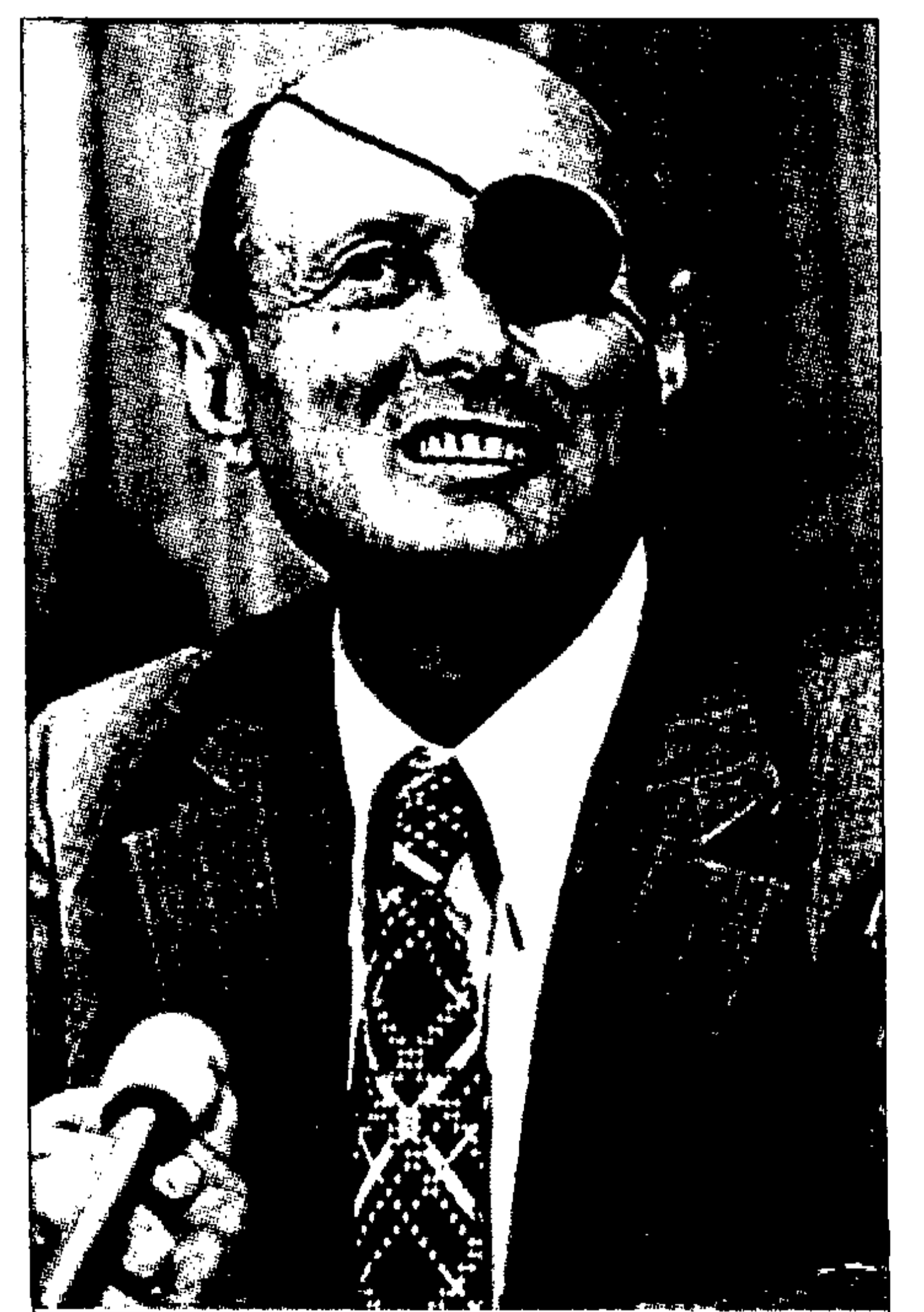
El general Moshe Dayan

El conflicto estalló en la madrugada del día 5 de junio y el Alto el Fuego, aprobado por la ONU, se produjo al anochecer del día 10. Fueron exactamente 132 horas de combate total y por eso pasó a la Historia como «La Guerra de los Seis días». Israel se enfrentó a todos los países árabes, que se habían unido para acabar con el Estado judío. Pero, por encima de todo, fue una guerra relámpago, ya que los ejércitos israelíes consiguieron en esas horas aplastar el que parecía en ese momento invencible ejército árabe. En las primeras horas la aviación judía acabó con la aviación árabe, a la que no le dieron tiempo ni a despegar de los aeropuertos militares. Invadieron Jordania y acabaron con las tropas del Rey Hussein y se apoderaron de los altos del Golan con graves pérdidas para Siria. El artífice de aquella aplastante victoria fue el general Moshe Dayan, aquel hombre que con su cortinilla negra cubriéndole el ojo izquierdo saltó a las portadas de todos los periódicos del mundo. Además se apoderaron de toda la península del Sinaí y de 428 carros de combate soviéticos, hicieron 23.000 prisioneros. Por la parte judía murieron 725 y hubo 2.500 heridos. Los muertos árabes superaron todas las previsiones.