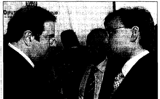
El director de 'El Día' (d) y el director de la agencia Ical (c) conversan con Herrera.