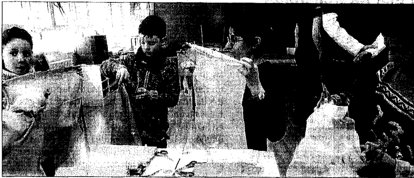
Un grupo de niños participa en el taller de elaboración de cometas.