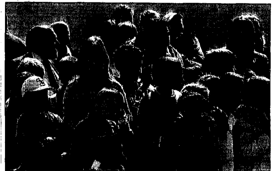
Público asistente a la inauguración del proyecto. / JESÚS LUQUE