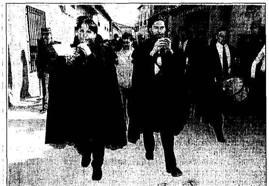
El grupo 'La Charambita' amenizó la jornada con sus dulzainas.