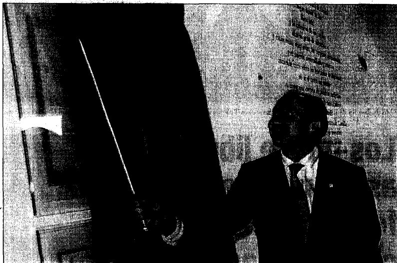
El presidente de la Diputación descubre la placa de inauguración del Centro e-LEA.

para la celebración de jornadas, como las que se celebrarán con motivo del Día del Libro con una serie de lecturas públicas sobre el Poema del Cid y Campos de Castilla (Antonio Machado).