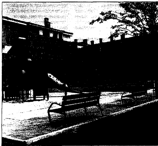
Urbanización La Vega, en el municipio de Arroyo.

La inmigración ha permitido a Valladolid salvar, por sólo 138 habitantes, la población neta que tenía hace diez años. Hoy es la capital de provincia con menor crecimiento demográfico de la Comunidad autónoma después de León (-5,7%). Soria (13,1%) y Ávila (12,9%) son las que más crecen. Le siguen Burgos (6,5%), Palencia (4,4%), Zamora (3,7%), Segovia (2,2%) y Salamanca (0,3%).