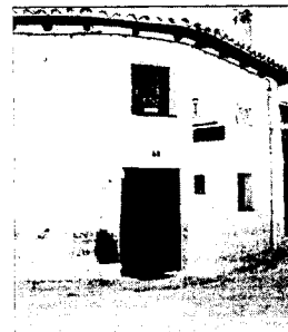
Casa rural de Villasexmir.

Como inicio de esta colaboración, la empresa está preparando