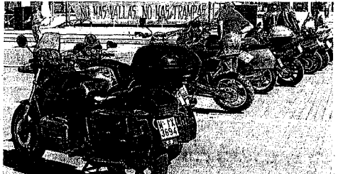
Exposición de modelos en la Plaza Mayor.