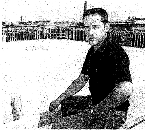
El alcalde de Montemayor en la plaza de palos del municipio.

—Tenemos en marcha medidas sociales que logran mantenernos por encima de los 1.000 habitantes y que consiguen que no perdamos servicios básicos. Entre ellas están el reglamento de parejas de hecho, las becas para el transporte para los estudios reglados fuera de la enseñanza obligatoria, la facilitación de terreno para la construcción de viviendas y las ayudas para el fomento de la natalidad, además de habilitar un