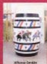
Alfonso Carallo "Los Caballeros de la Talla Redonda"