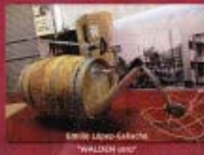
Emilio López-Galacho "WALDEN 0101"